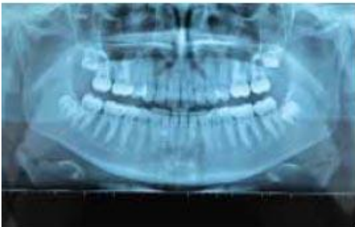
Fig 5 : Radiographies

Sensibilité : La palpation profonde des muscles élévateurs a pour objet la recherche de douleurs, de raideurs musculaires, de « bandes tendues » douloureuses. Une douleur à la palpation du masséter profond droit et du masseter superficiel droit apparaît à la palpation.