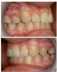
Fig 3 : photographies intrabuccales