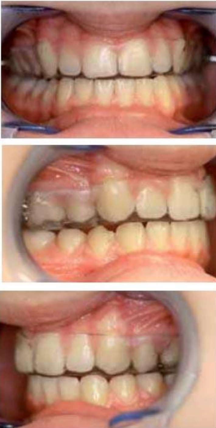
Fig 7 : La gouttière maxillaire est désolidarisée pour devenir une simple orthèse de stabilisation, dans la deuxième étape du traitement.

Après la pose de l'orthèse et la prescription des exercices de rééducation fonctionnelle, la patiente sera revue régulièrement pour suivre l'évolution et la résolution du dysfonctionnement. Lors de ces consultations nous évaluons à chaque séance l'évolution de la douleur et du handicap sur l'échelle analogique. Nous observons également les amplitudes des mouvements mandibulaires. Les conseils