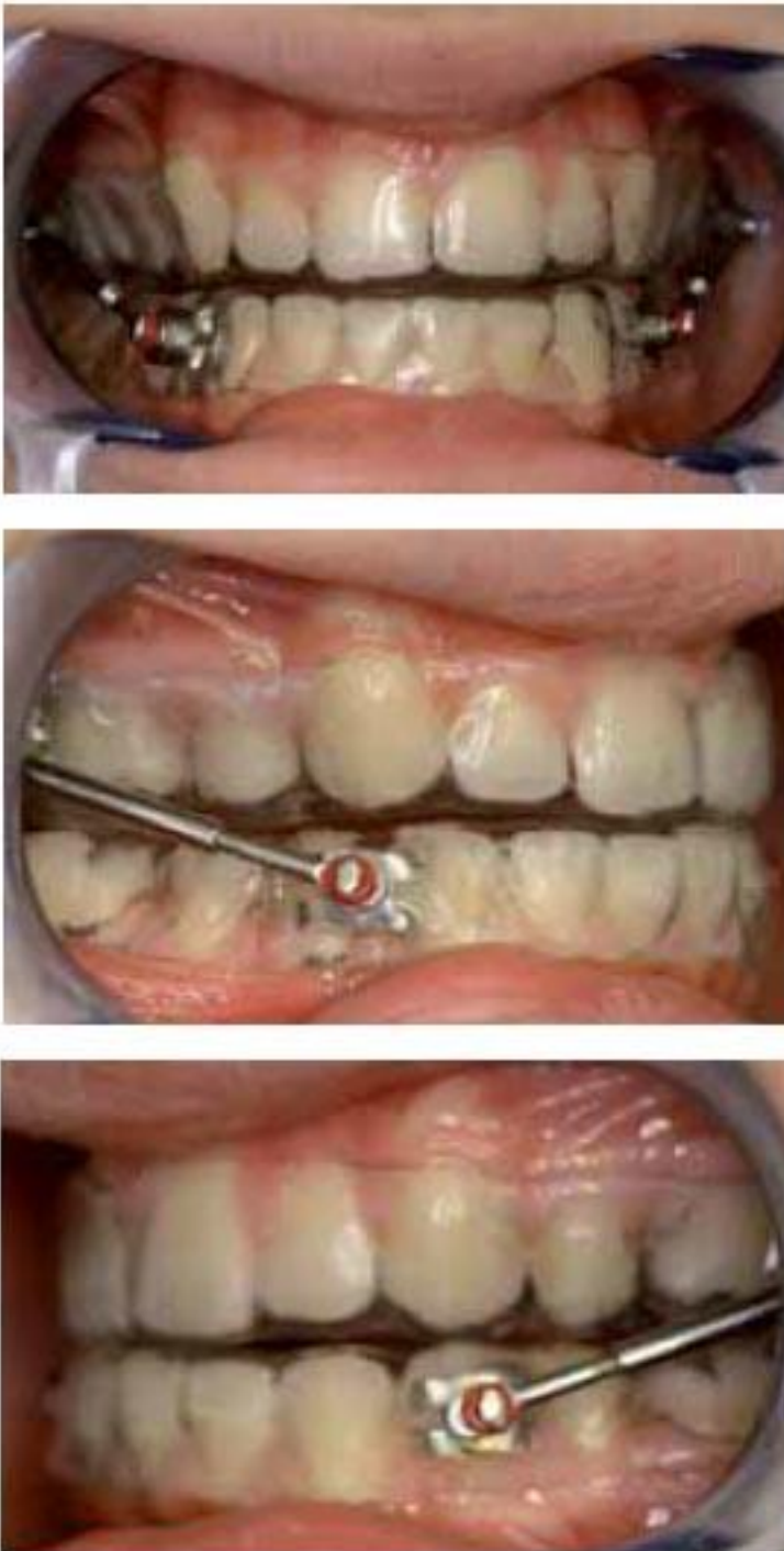
Fig 6 : L'orthèse de contention articulaire (OCA) : elle se compose de deux gouttières. Les attelles latérales maintiennent une légère propulsion (entre deux et trois mm). Elles sont réglables et ajustables par les tiges filetées bilatérales. Son action permet une immobilisation et une véritable décompression des ATM. L'orthèse maxillaire est conçue sur les critères d'une orthèse de "libération occlusale ". Elle peut se désolidariser de la gouttière mandibulaire pour la deuxième phase du traitement. Le traitement